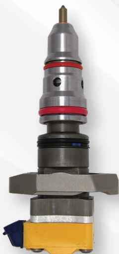
2-38987 Pickups Ford F, Camionetas E (2003-99) International Trucks (2002-99)