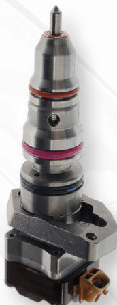
2-17626 Pickups Ford F, Camionetas E (1999-95)