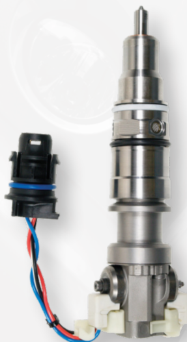
2-38988 Pickup Ford F (2004-03) International Trucks (2003-02)