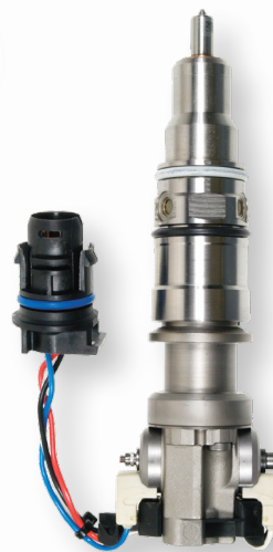
2-38989 Pickup Ford F (2010-04) International Trucks (2012-04)