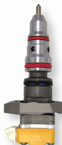
2-18028 Pickups Ford F, Camionetas E (2003-99) International Trucks (2002-99)